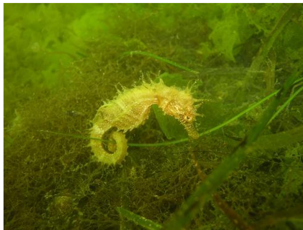
Presque tous ont réussi à observer ce poisson si mythique !