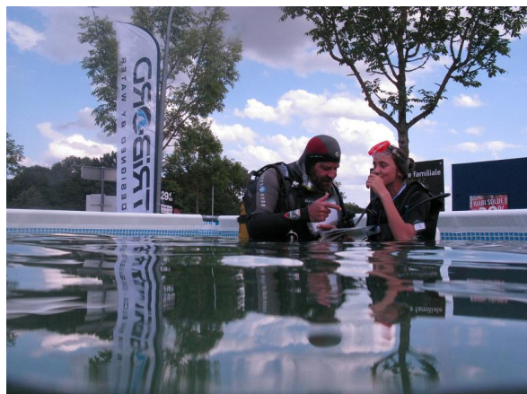
65 baptêmes réalisés par sept moniteurs...

Cette année, pour la « Tribord Diving Experience », nous nous étions entourés de trois moniteurs biologistes sous-marin sur un effectif des six encadrants du matin et des sept de l'après-midi ! La bonne humeur et l'excellente entente de l'équipe ont fait oublier la température un peu fraîche de l'eau de la piscine.