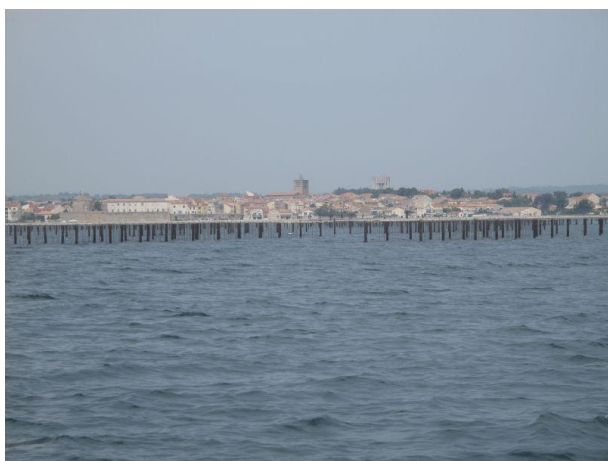
Mèze, village d'accueil et ses parcs conchylicoles

L'accueil qui nous a été réservé par l'Ecole de Plongée Sétoise a été peu ordinaire. Les deux pilotes ont été "aux petits soins" en permanence pour nous, nos horaires s'adaptant parfaitement aux nôtres et le choix des sites se sont fait de façon collégiale. Ils nous ont même organisé le samedi soir, un apéro "fruits de mer" (huîtres, crevettes, différents coquillages) face au coucher du soleil sur le port dont les participants se souviendront longtemps !